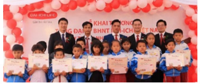
Nhân dịp khai trương văn phòng mới, Công ty BHNT Dai-ichi Việt Nam đã trao 20 suất học bổng cho học sinh vượt khó học giỏi trên địa bàn huyện Đức Trọng.

Ngày 2/4/2021, Dai-ichi Life Việt Nam đã chính thức khai trương Văn phòng Tổng Đại lý Đức Trọng tại Số 16 Duy Tân, thị trấn Liên Nghĩa, huyện Đức Trọng, tỉnh Lâm Đồng. Hiện nay, Dai-ichi Life Việt Nam có 270 Văn phòng và Tổng Đại lý hoạt động trên toàn quốc.