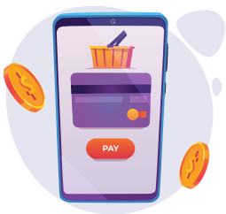
Đóng phí qua ứng dụng Payoo trên thiết bị di động

Khách hàng có thể lựa chọn thanh toán phí qua Payoo bằng nhiều hình thức: