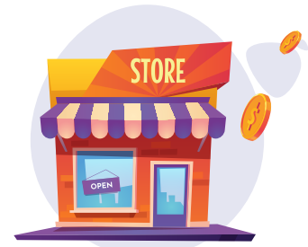
Đóng phí trực tiếp bằng tiền mặt tại hơn 2.400 cửa hàng liên kết với Payoo toàn quốc

• Tại nhiều cửa hàng siêu thị tiện lợi phổ biến