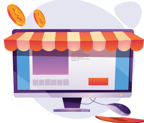
Đóng phí qua website Payoo https://bill.payoo.vn/