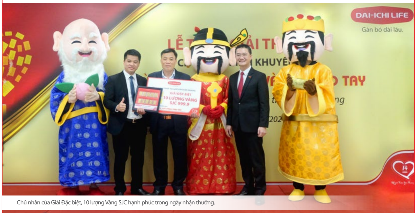
Chủ nhân của Giải Đặc biệt, 10 lượng Vàng SJC hạnh phúc trong ngày nhận thưởng.

Thông tin chi tiết về chương trình, vui lòng xem thêm tại link: http://bit.ly/dlvn-locvangtraotay