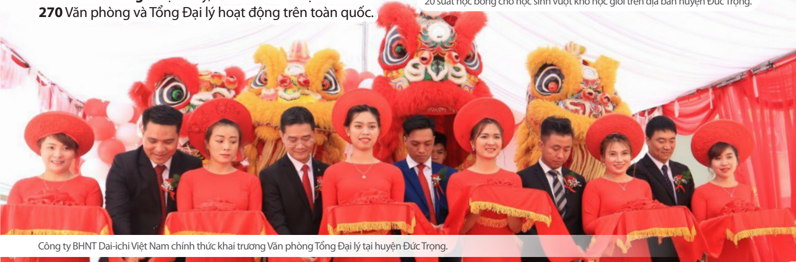
Công ty BHNT Dai-ichi Việt Nam chính thức khai trương Văn phòng Tổng Đại lý tại huyện Đức Trọng.