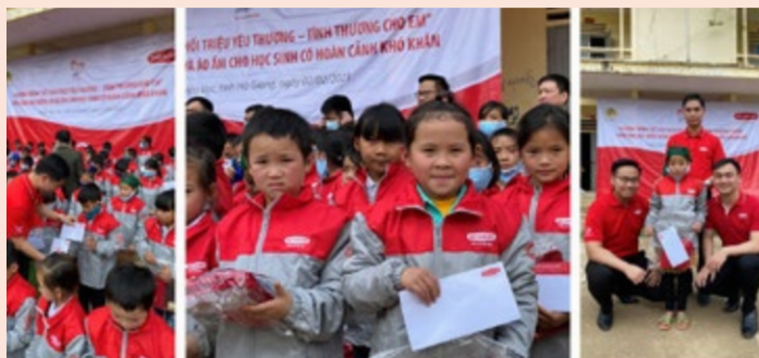
Niềm vui của các em nhỏ trường Phổ thông Dân tộc Bán trú Tiểu học Nậm Ban, huyện Mèo Vạc, tỉnh Hà Giang trong ngày nhận học bổng và áo ấm.